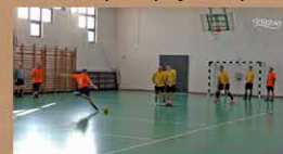
III. Dagober Tahitótfalu SE Kupa

Elérhetőségeink: 2022 Tahitótfalu, Mátyás király u. 3.; Tel.: 06-70-940-5034, danubiatv@gmail.com