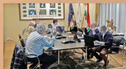
Önkormányzati ülés közvetítése