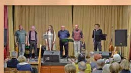
Kelta advent a M.É.Z. együttessel