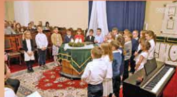
Református istentiszteletet közvetítése

Adásunk fogható a Magyar Telekom IPTV-rendszerén a 260-as csatornán