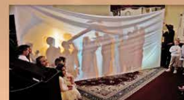
Az Advent Tahitótfalun záró rendezvénye Az óvodások műsora