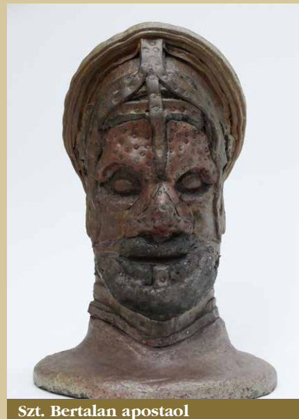
Szt. Bertalan apostol

Festő, szobrász, grafikus, művészeti író életrajzi adatok