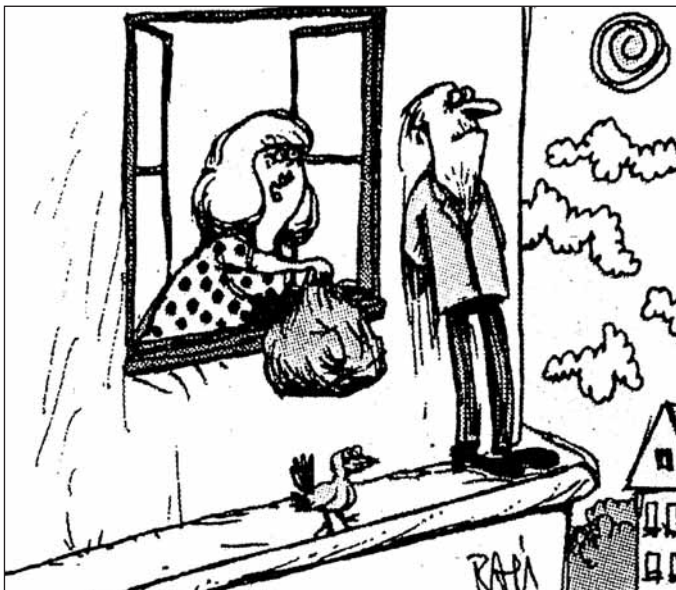
Ha legrasz, vidd magaddal a szemetet is!